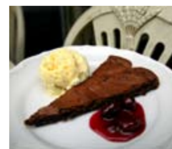
Chokladkaka toppad med färskostglass och körsbärssylt.

■ Skala rotsakerna och skär i mindre bitar. Blanda rapsoljan med kryddorna. Sprid ut sprid ut rotsakerna på en plåt och ringla över oljan med kryddor. Rosta i ugn 225 grader i cirka 30 minuter tills rotsakerna är genomstekta.