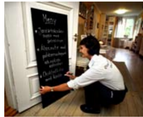
Dagens meny är klar. Den som valt att använda små producenter får vara beredd på snabba förändringar - tillgången av råvaror varierar.