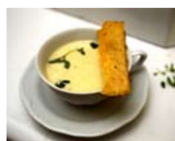
Mild jordärtskockssoppa med getostchips.